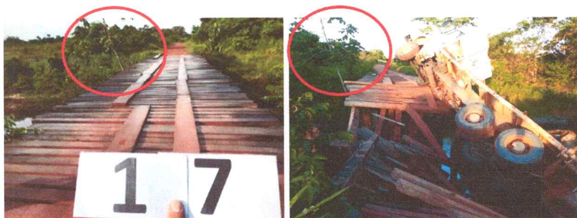
Figura 6. Ponte classificada como crítica no monitoramento realizado dia 19/11/2021, queda da ponte no dia 22/11/2021, devido ao excesso de peso do caminhão, não houveram vítimas.

Empresa Júnior de Ciências Agrárias de Roraima