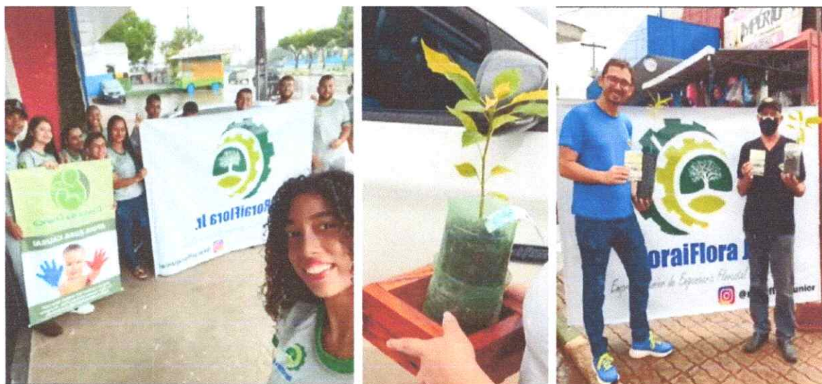
Figura 1. Equipe Roraiflora com patrocínio da clínica da criança para doação de mudas em Rorainópolis.

11. Doação e distribuição de 500 mudas florestais e frutíferas em alusão ao dia do Engenheiro Florestal, em 2022;