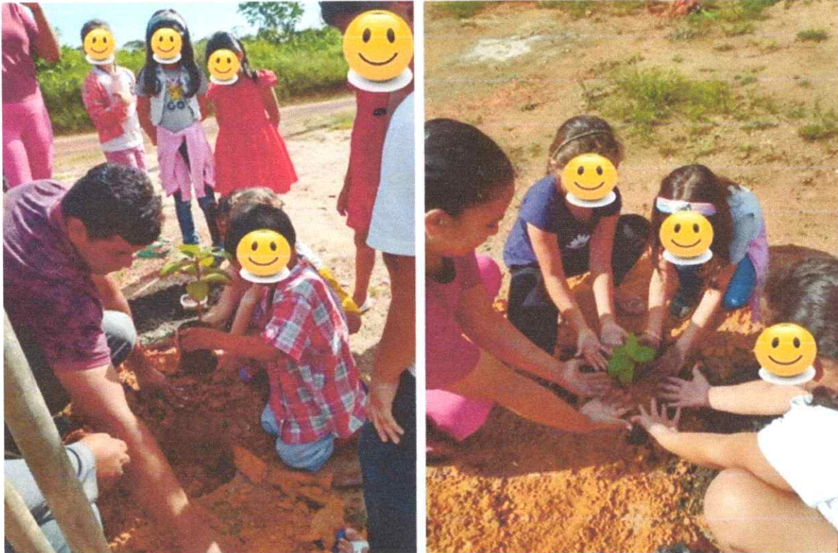
Figura 3. Abertura de covas e plantio de árvores na Escola Municipal José Alves Barbosa, vicinal 03, Rorainópolis.

Empresa Júnior de Ciências Agrárias de Roraima