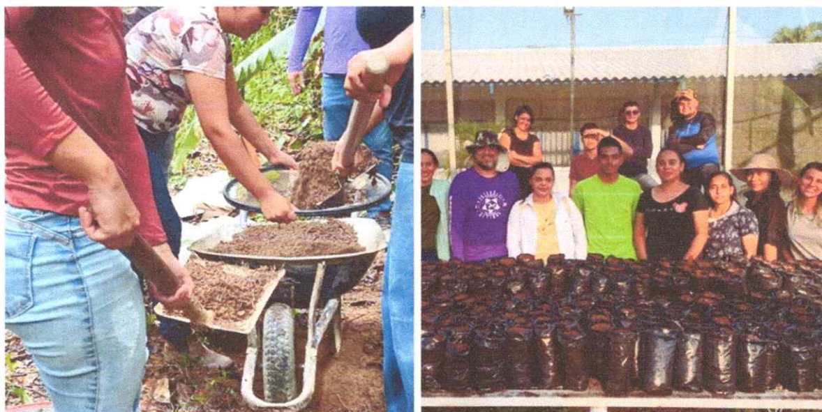
Figura 5. Coleta de solo e plantio de sementes de espécies nativas no campus Rorainópolis.

1. Coleta de solo, confecção de sementeira e produção de aproximadamente 2000 mudas de espécies nativas e frutíferas para doação e distribuição à população em evento a ser definido.