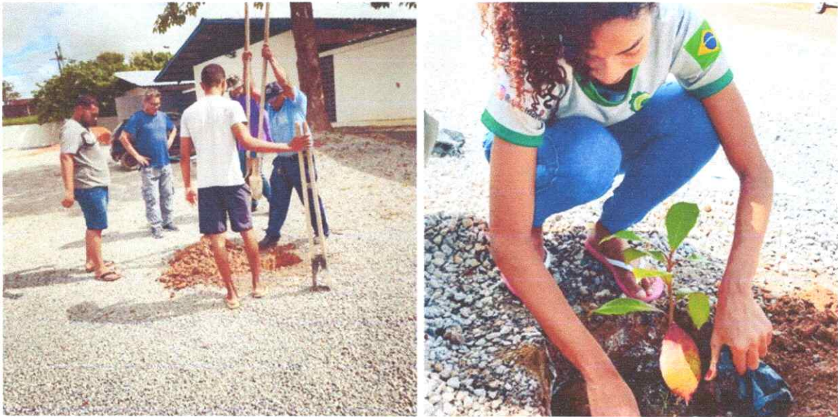
Figura 2. Abertura de covas e plantio de árvores no estacionamento do campus Rorainópolis.

12. Arborização do estacionamento do Campus UERR, Rorainópolis em 2023;