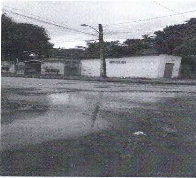
BAIRRO: NOVO BRASIL RUA: MARANHÃO/ANTONIO A. DE SOUSA