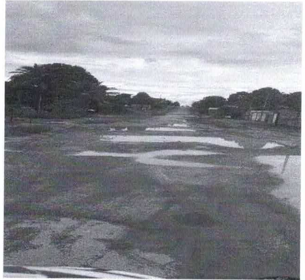
BAIRRO: CAMPOLÂNDIA RUA: ARACAJU