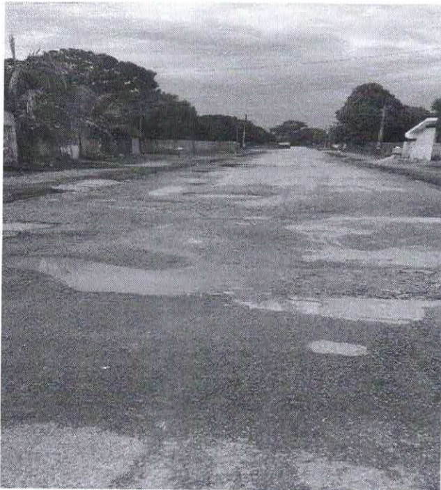
BAIRRO: NOVO BRASIL RUA: HILDEMAR P. DE FIGUEIREDO