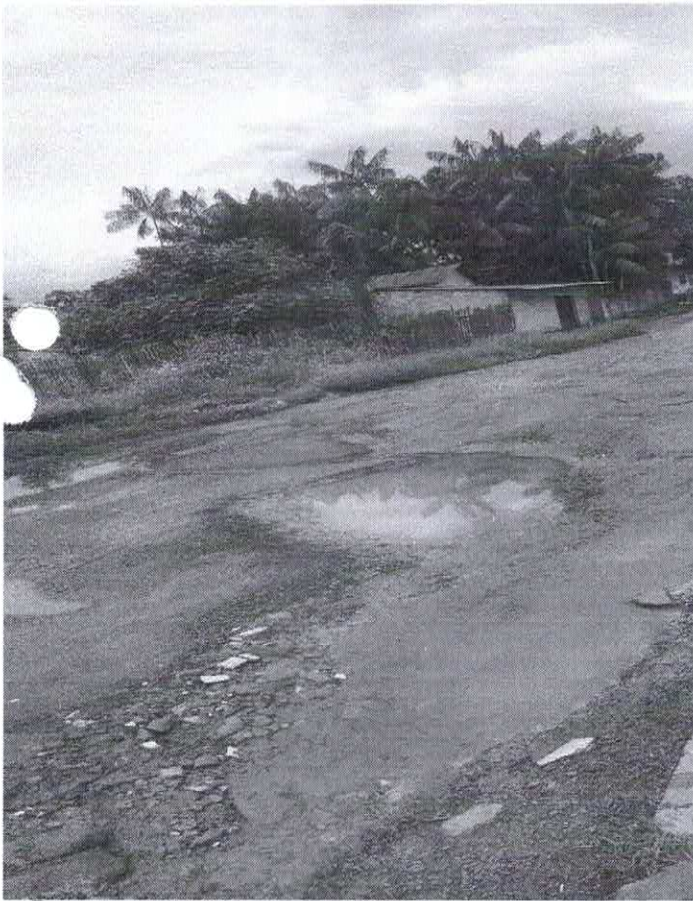
BAIRRO: CAMPOLANDIA RUA: SÃO LUIS