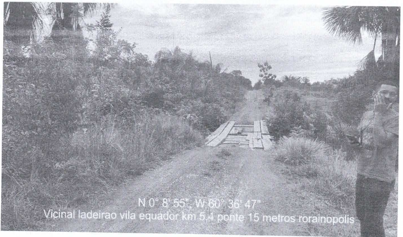
N 0° 8' 55", W 60° 36' 47" Vicinal ladeirao vila equador km 5,4 ponte 15 metros rorainopolis