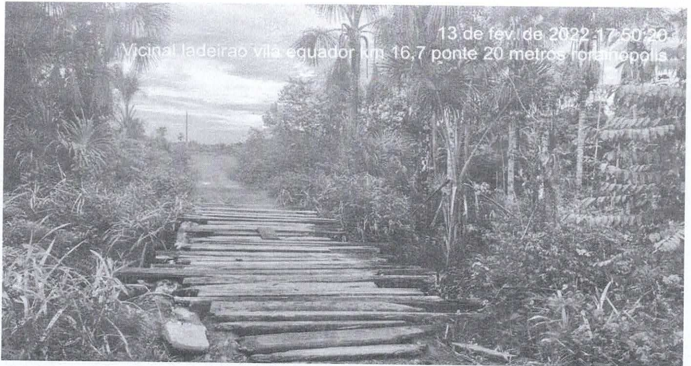
13 de fev. de 2022 17:50:20 Vicinal ladeirao vila equador km 16,7 ponte 20 metros rorainopolis